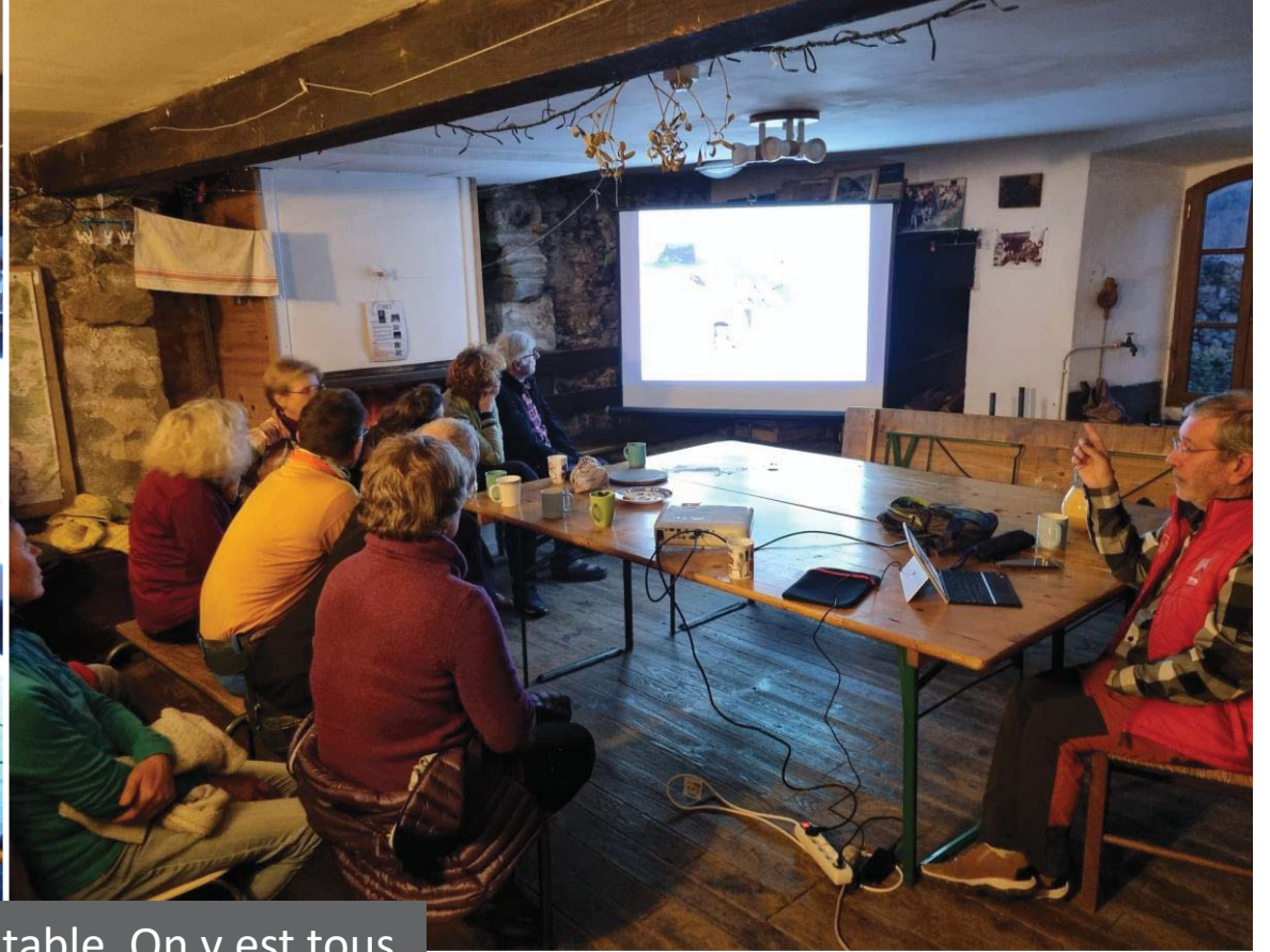
23 en cours, 23 à table. On y est tous