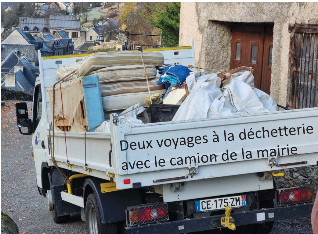
Deux voyages à la déchetterie avec le camion de la mairie