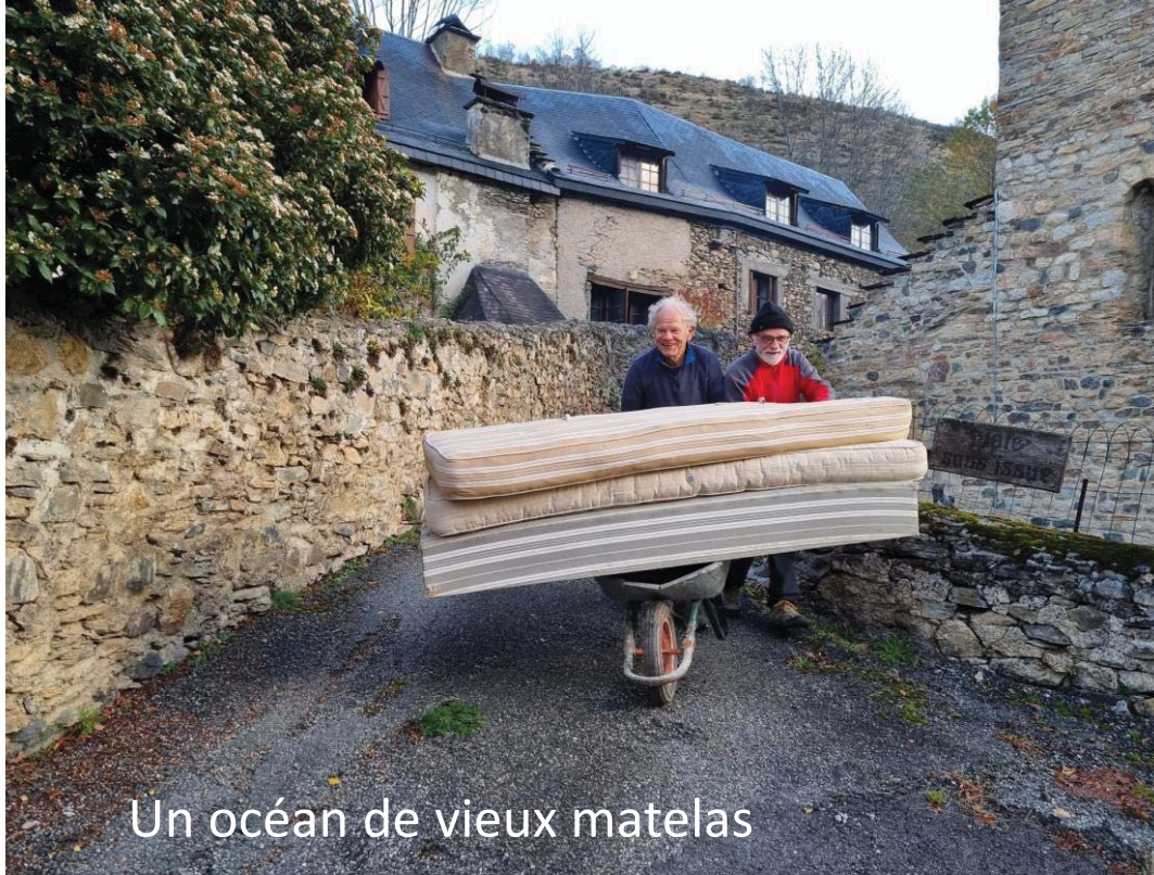
Un océan de vieux matelas