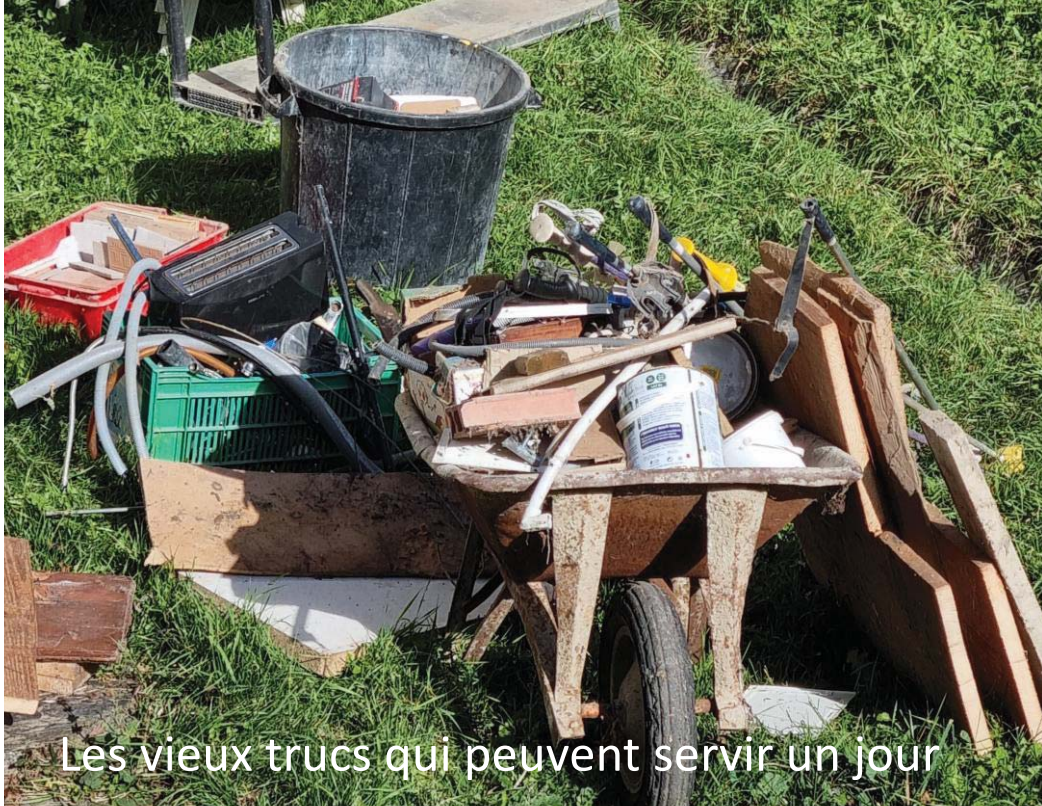
Les vieux trucs qui peuvent servir un jour